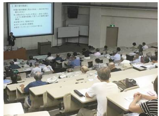
公開教養講座 2017 の様子