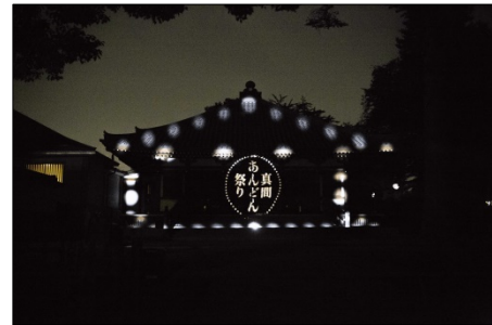
昨年プロジェクションマッピングの様子

紅葉の名所であった弘法寺が、今は伏姫桜の名所になっていることをプロジェクションマッピング上で表現することで無常観を表現します。