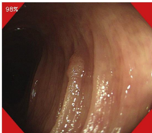
図 2. 実装済みソフトウェアのアウトプット